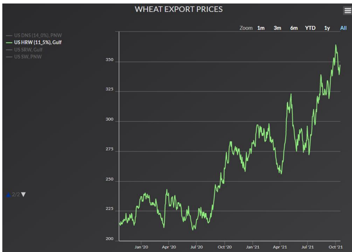
Figure 2: évolution du prix du blé 2020/2021

Le problème de ces prédictions utopistes récurrentes, c'est qu'elles servent de base pour leurs simulations à la Commission Européenne, mais aussi aux institutions internationales dans leur ensemble. Qu'il s'agisse des impacts des accords de libre-échange ou des conséquences liées à l'application du Green Deal, les modèles d'équilibre général restent le seul outil à disposition des instances dirigeantes mondiales, alors qu'il serait temps de changer de logiciel.